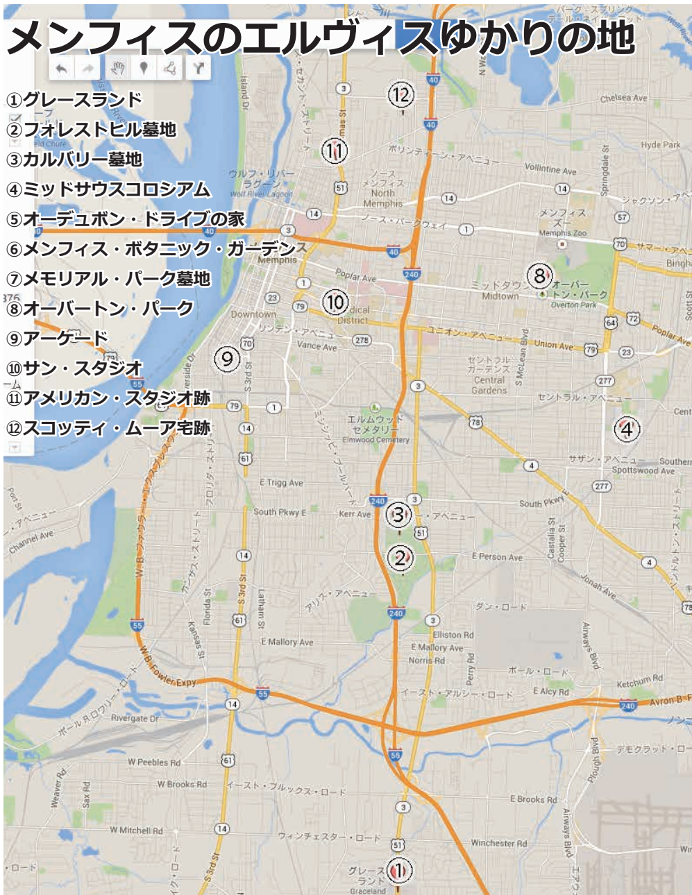
EPJAPAN エルヴィスゆかりの地巡り